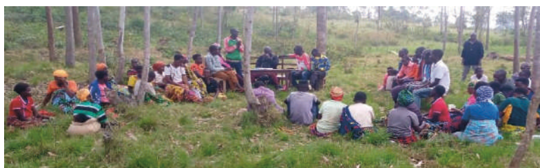
Rencontre des membres des VSLA des collines KABUYE et CAGURA dans la commune Ruhororo / province Ngozi

Ces groupements ne sont pas uniquement des groupements d'épargne et de crédit comme on le voit ailleurs mais sous l'encadrement de WHH et UNIPROBA leurs membres profitent de l'occasion pour discuter des thématiques de nutrition, VIH/SIDA, Covid 19, sécurité alimentaire, cohésion sociale, eau-Hygiène et assainissement, droit de femmes et des minorités ethniques, Violences Basées sur le Genre, etc.