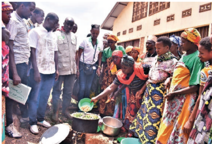
Des membres de la coopérative « Abatabazi » suivent une séance de démonstration culinaire sur la colline Budahunga en commune Bwanganarangwe dans la province Kirundo

Ce projet ci haut indiqué est financé par le Ministère Fédéral des Affaires Etrangères de la République Fédérale de l'Allemagne (AA) à travers WHH et implémenté par deux organisations nationales : la Fondation Stamm et l'Organisation Diocésaine pour l'Entraide et le Développement Intégral de Muyinga (ODEDIM).