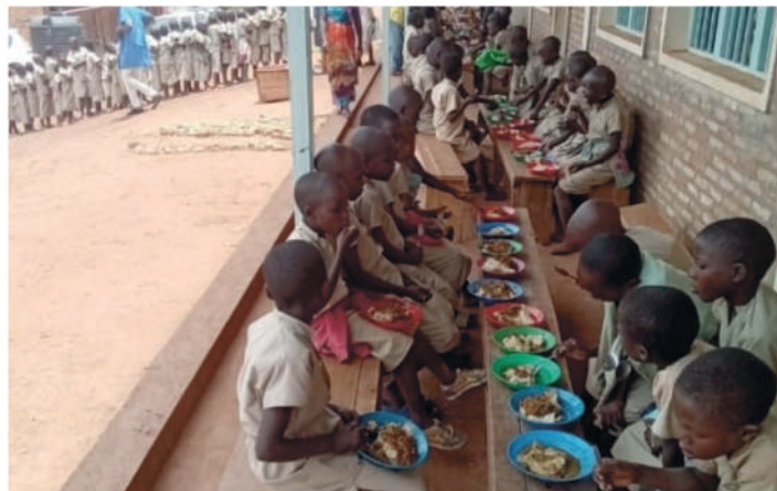
Grâce à l'action de WHH en partenariat avec le PAM, les élèves reçoivent le repas chaud chaque jour de classe à l'ECOFO Renga