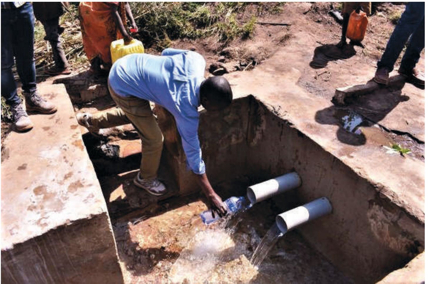
Source Rugari II sur la colline Gasanda dans la commune Gisuru / province Ruyigi

En effet, 40 (29 construites et 11 réhabilités) sources d'eau potables sur 120 prévues pendant les trois années d'exécution du projet sont déjà aménagées et protégées par WHH en partenariat avec la « Fondation STAMM » dans les communes de Bugabira et Busoni en province de Kirundo, Muyinga et Giteranyi en province de Muyinga ainsi que Gisuru et Kinyinya en province de Ruyigi afin d'améliorer les conditions de vie des populations vulnérables en leur facilitant l'accès à l'eau potable.