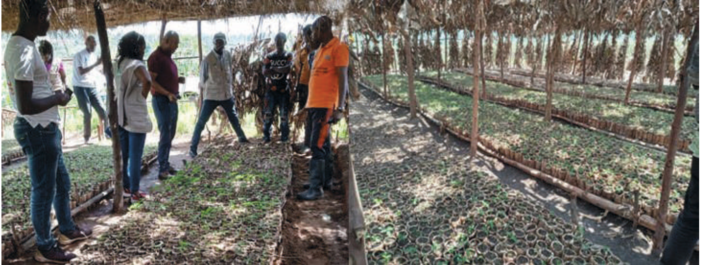
Visite des autorités administratives du site de pépinières appuyé par WHH en collaboration avec RBU 2000+ et BBIN sur la colline Kagara dans la province Muinga

À l'issue de ces 5 jours de visite, La délégation du ministère de l'Intérieur, du Développement Communautaire et de Sécurité Publique s'est montrée satisfaite des réalisations de WHH exécutées de manière professionnelle sur le terrain avec ses ONGs partenaires : « RBU 2000 Plus », « ODEDIM », « BBIN » et la « Fondation Stamm ». Elle a particulièrement apprécié les aspects d'appropriation et de pérennisation des projets visités et la forte implication de l'administration à la base (administration communale, zonale et collinaire) ainsi que celle des populations.