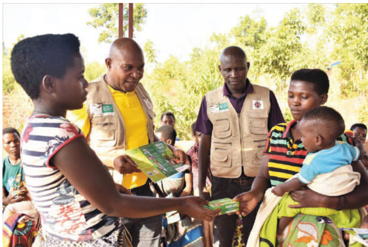
Des membres de la coopérative « Abatabazi » suivent une séance de démonstration culinaire sur la colline Budahunga en commune Bwanganarangwe dans la province Kirundo