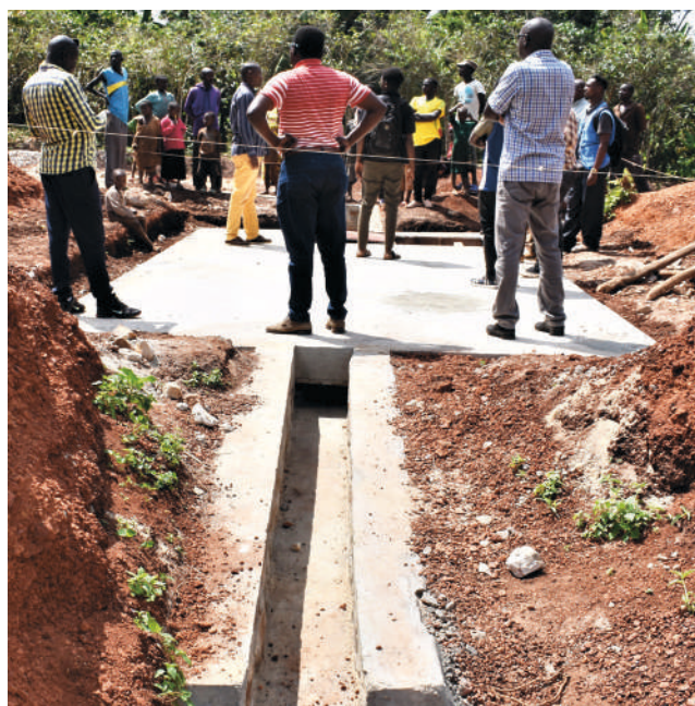
Un ouvrage souterrain de collecte d'eau de pluie dans la commune Gitobe en province de Kirundo

Les administratifs et les petits agriculteurs participants au projet de ces ouvrages indiquent qu'avec ces ouvrages souterrains de collecte des eaux de pluie, ils seront capables de cultiver pendant toutes les trois saisons (A, B et C) par an et par conséquent que les récoltes seront en général suffisantes en quantité et en qualité. Le projet est financé par BMZ sur une durée de 42 mois (01.12.2020 - 31.05.2024)